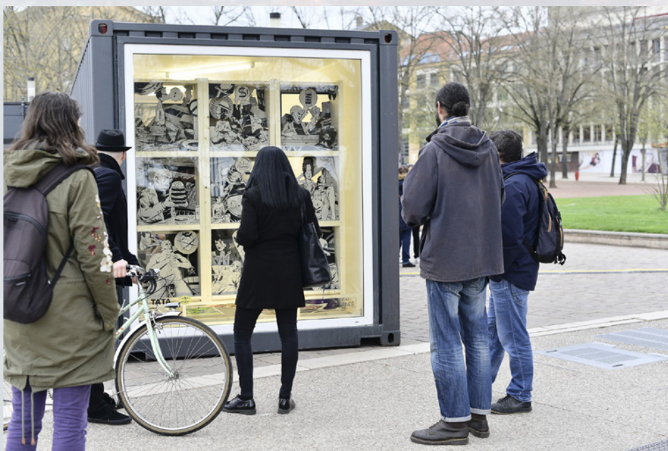
© Exposition EXPOPOPUP de Val'encLume, © Nicolas Silesti

Du 12 au 17 novembre à Bliida, 7 avenue de Blida - Metz